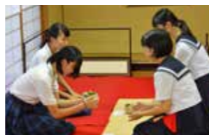
茶道部で お点前を体験